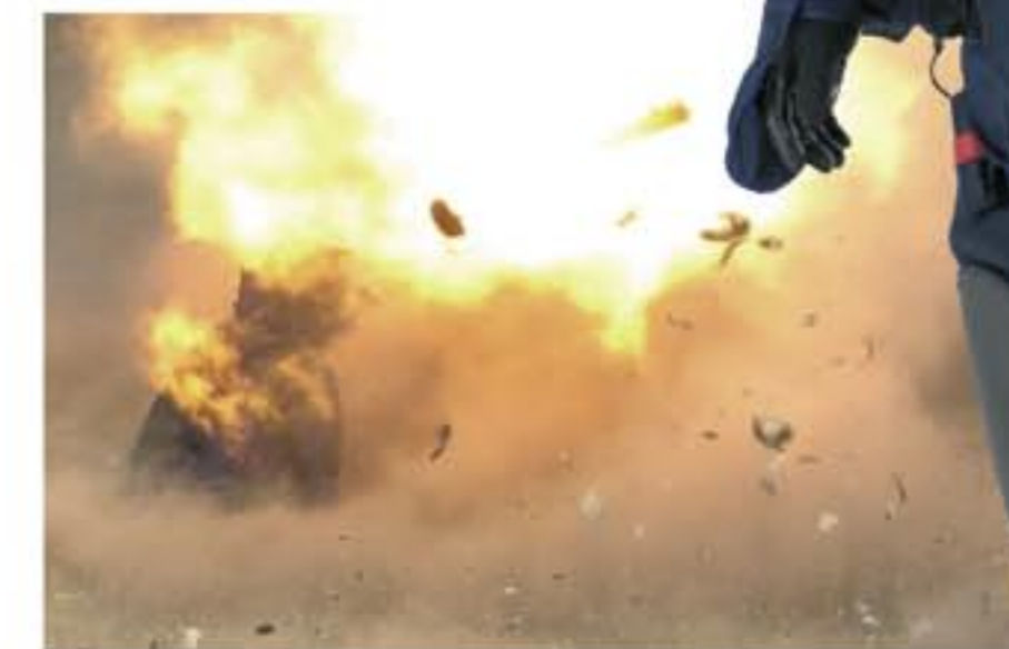
Hochgeschwindigkeitsaufnahme: EOD-Schutzanzug SPS-3 Sprengtest mit 0,66 kg Pentolite aus 60 cm Entfernung.

Die Anforderungen an unsere Produkte verändern sich ständig. Wir sind deshalb mit unseren Entwicklungen immer einen Schritt voraus. Tests unter realitätsnahen und unter Labor- Bedingungen garantieren die Zuverlässigkeit unserer Produkte und damit Ihre Sicherheit.