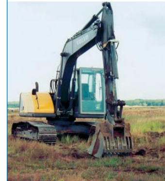
Abb. 9 Maschinelle Kampfmittelräumung

Auf der Grundlage des § 4 Arbeitsschutzgesetz ist zu prüfen, inwieweit ein maschinelles Räumverfahren anwendbar ist. In Abhängigkeit von den örtlichen Gegebenheiten (z.B. zu erwartende Munitionsart und -sorte, Topographie, Bewuchs) und von dem bei der Auftragsvergabe festgelegten Räumziel sind auch händische Arbeitsverfahren möglich. Die Gefährdung bei den händischen Arbeitsverfahren zur Freilegung ist wesentlich abhängig vom eingesetzten Arbeitsmittel (Werkzeug), was seinerseits wiederum abhängig ist von dem Boden, der das Kampfmittel umgibt.