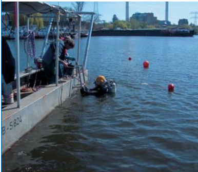
Abb. 8 Einsatz von Kampfmitteltauchern

Siehe auch Unfallverhütungsvorschrift „Taucherarbeiten“ (BGV C23).