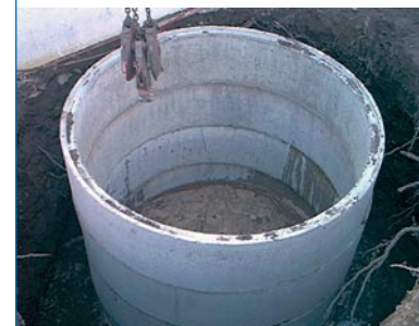
Abb. 10 Sicherung der Grabenwände mit nicht-ferromagnetischen Verbau

Je nach Tiefenlage der Kampfmittel sind Baugruben oder Böschungen anzulegen. Hierfür sind die Vorgaben der §§ 6 und 28 der Unfallverhütungsvorschrift „Bauarbeiten“ (BGV C22) in Verbindung mit DIN 4124 zu beachten.