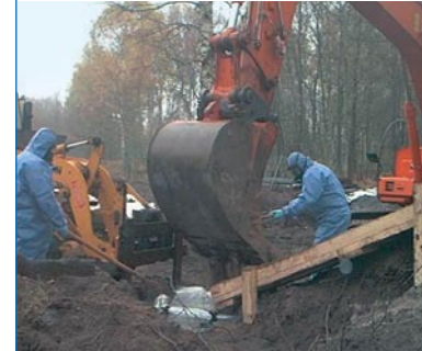
Abb. 13: Bodenaushub zur Kampfmittelräumung in kontaminierten Bereichen nach BGR 128 unter Verwendung persönlicher Schutz-ausrüstung

Bei der Ausrüstung von kleineren Bau-maschinen, z.B. Minibaggern mit zu-sätzlichen Schutzeinrichtungen, ist deren Einwirkung auf die Betriebs-sicherheit der Maschine (z.B. Stand-sicherheit) zu beachten.