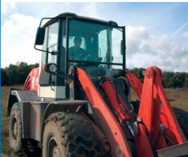
Abb. 12: Bagger mit Sicherheitsverglasung