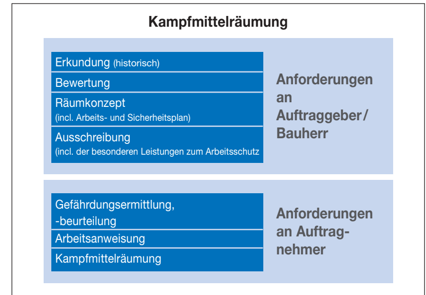
Abb. 3: Aufgabenteilung zwischen Auftraggeber und Auftragnehmer in Bezug auf den Arbeitsschutz

Bei Arbeiten der Kampfmittelräumung ist das Räumkonzept eine unverzichtbare Grundlage für die Ausführungsplanung und Leistungsbeschreibung. Die einzelnen Planungsschritte zur Erstellung des Räumkonzeptes sind in den „Arbeitshilfen Kampfmittelräumung“ des Bundes [1] sehr detailliert beschrieben. Deshalb wird innerhalb dieser BG-Information darauf Bezug genommen. Bestandteil des Räumkonzeptes ist auch der sogenannte „Arbeits- und Sicherheitsplan“ (zu Gliederung und Inhalten siehe Anhang 4). Mit Hilfe des Arbeits- und Sicherheitsplans kann der Bauherr/Auftraggeber seine Informationspflichten (siehe Anhang 1) erfüllen, indem er damit alle die Informationen bereitstellt, die die ausführenden Unternehmen zur Erfüllung ihrer Pflichten und insbesondere zur Erstellung der Gefährdungsbeurteilung benötigen (siehe Abschnitte 3.2. und 4).