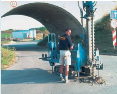
Abb. 7 Bohrlochsondierung

Bei der Gefährdungsbeurteilung für die Tiefensondierung sind zwei wesentliche Faktoren zu beachten: