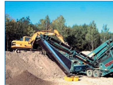
Abb. 15: Einsatz von Separieranlagen

Die Separieranlage ist durch eine entsprechende Schaltung stillzusetzen, wenn der Anlagenführer den gesicherten Arbeitsplatz verlässt.