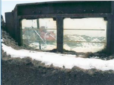
Abb. 14: Schutzeinrichtung Wand aus Sicherheitsglas